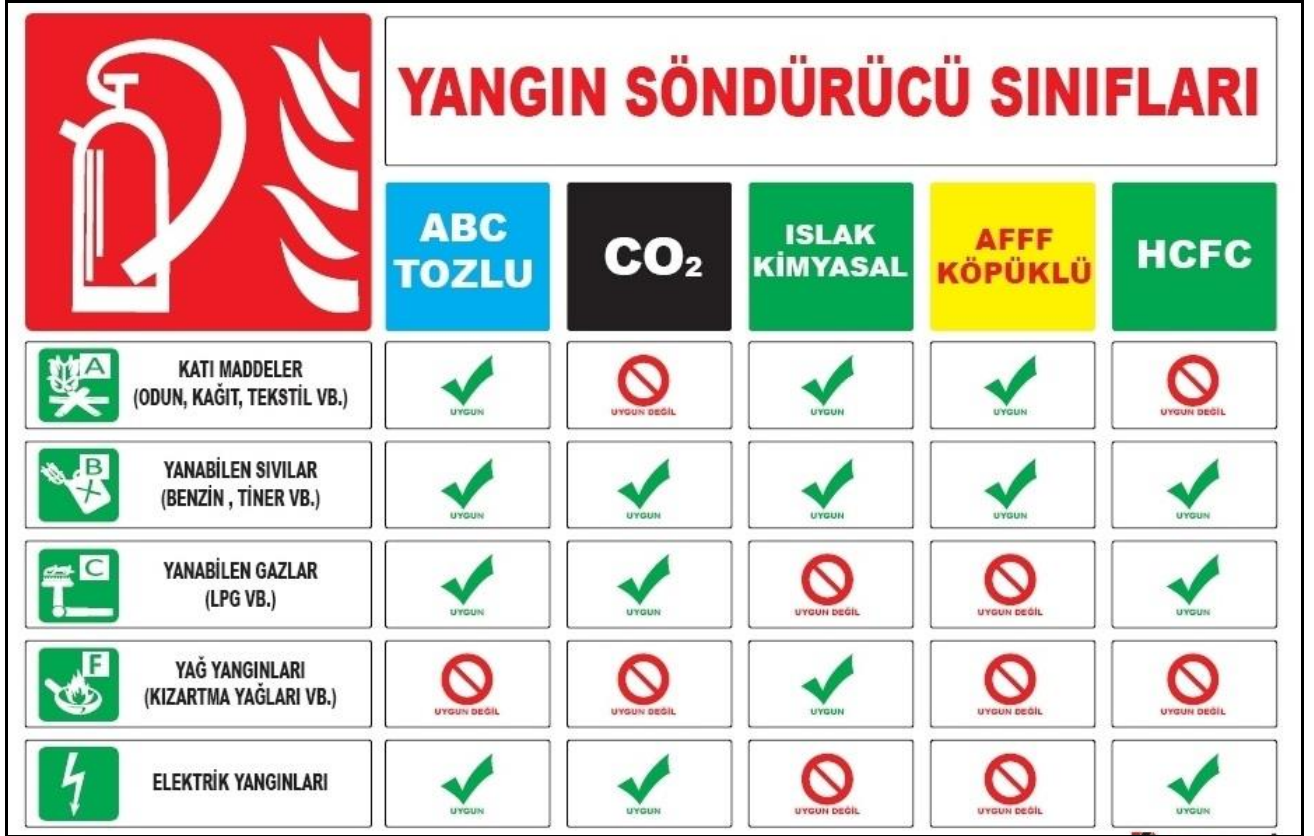
Şekil-1 Yangın Cinsine Göre Kullanılacak Söndürme Ekipmanları

Yangın cinsine göre Şekil-1 de gösterilen söndürme ekipmanları kullanılacaktır.